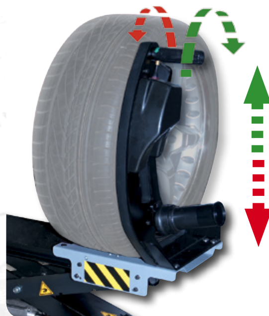
Regulable con una sola mano

SIMPLE. La altura de la rueda se ajusta mediante una simple rotación el mango.